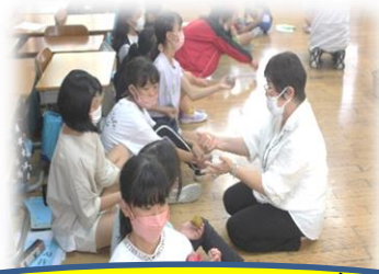
お手玉・しまくとうば