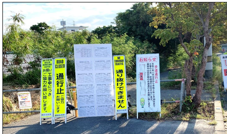
メイクマン入り口 この先 「はま寿司」 に向かったのり坂は通行止めになっています。具志川ジャスコ方面に行くには、江洲交差点まで戻り、反対側に横断する必要があります。