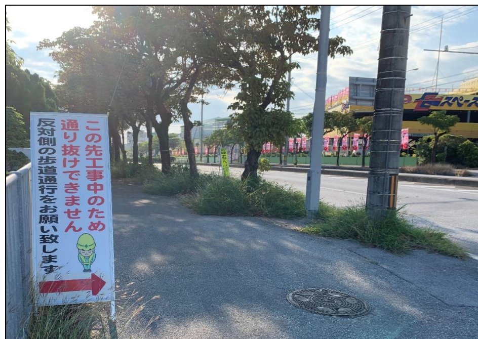
江洲交差点（メイクマンの角） に反対側へ移動する案内表示板があります。 ※ 具志川ジャスコ訪問へ行く場合、歩道が使えるのは パチンコ店側だけです。 反対側の歩道へ行く場合はこの交差点のみですのでご注意ください。