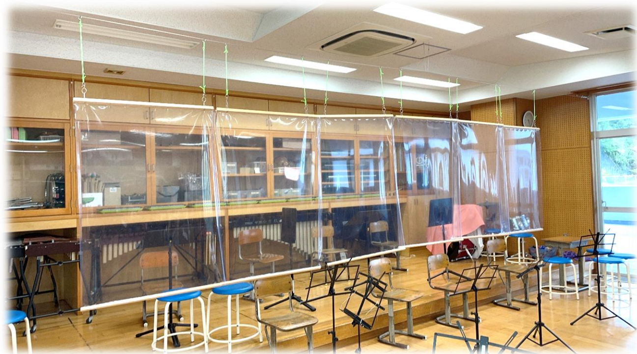
音楽室の発表スペース