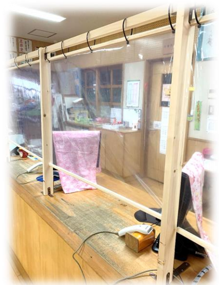
図書館の貸し出しカウンター