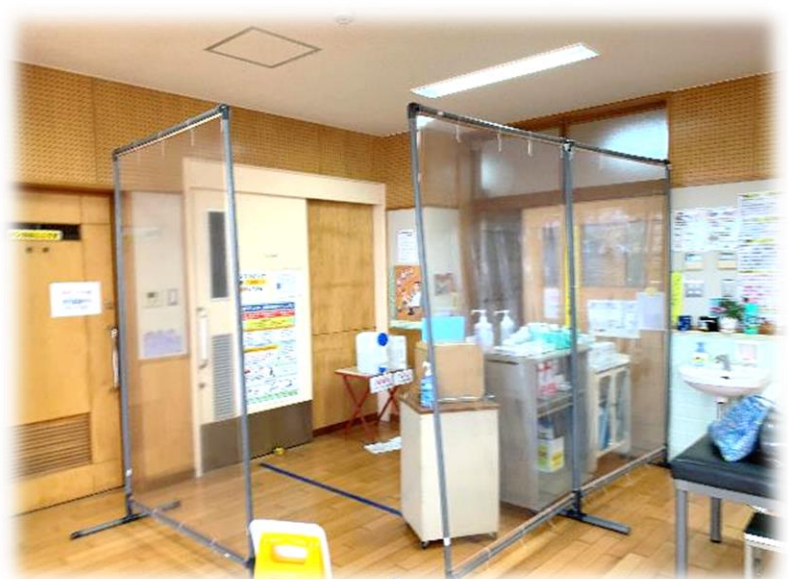
発熱の子が入りする保健室の入り口。発熱以外で来室する子への対応に留意しています。