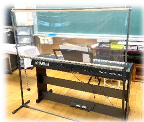
ピアノ・キーボード周辺の飛沫感染防止